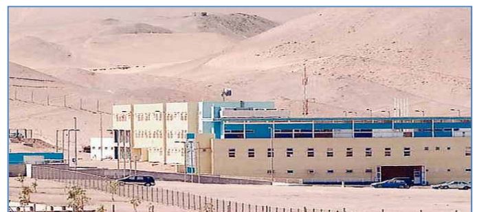
Establecimiento Penitenciario de Alto Hospicio